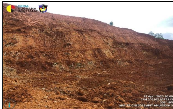
Gambar 2. Penyebaran Ore Bersifat Heterogen

Berdasarkan gambar 2 ore yang bersifat tidak homogen dapat menyebabkan terjadinya perubahan kadar nikel dikarenakan pada saat kegiatan ore getting dapat terikut pengotor ( waste ) ke dalam produk ore (Pranata dkk, 2017). Sehingga dalam melaksanakan kegiatan ore getting perlu diperhatikan oleh grade control yang berfungsi untuk membantu operator dalam pelaksanaan kegiatan ore getting .