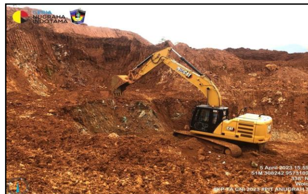
Gambar 3. Posisi waste terhadap ore dan cuaca

Berdasarkan gambar 2 ore yang bersifat tidak homogen dapat menyebabkan terjadinya perubahan kadar nikel dikarenakan pada saat kegiatan ore getting dapat terikut pengotor ( waste ) ke dalam produk ore (Pranata dkk, 2017). Sehingga dalam melaksanakan kegiatan ore getting perlu diperhatikan oleh grade control yang berfungsi untuk membantu operator dalam pelaksanaan kegiatan ore getting .