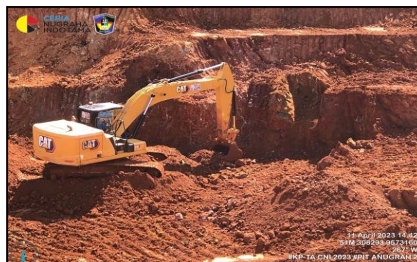
Gambar 4. Penyebaran Ore Bersifat Heterogen

Berdasarkan gambar 3 dapat diketahui dalam area front penambangan posisi waste dan ore selalu berdekatan. Sehingga hal ini bisa menyebabkan terjadinya perubahan kadar nikel. Kadar nikel dapat dipengaruhi oleh cuaca hujan dengan adanya hujan maka dapat menyebabkan kadar moisture content pada produk ore mengalami peningkatan sehingga hal ini dapat menyebabkan produk ore menjadi rusak atau tidak memenuhi kebutuhan buyer .