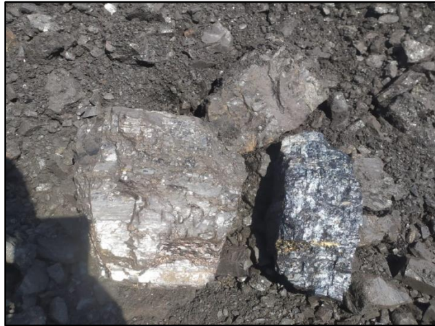
Gambar 3. Sampel batubara pada stockpile Muara Bengalun

Beberapa parameter digunakan untuk mendeskripsikan sampel batubara, antara lain meliputi warna, tekstur, struktur dan komposisi mineralnya. Sampel yang diambil pada stockpile memiliki warna segar berupa hitam mengkilap, dan warna lapuk putih kecoklatan. Jenis sampel merupakan batuan sedimen dengan tekstur non klastik , berdasarkan ciri khas warna dan struktur dari batuan ini dapat dikatakan sebagai batuan sedimen bernama batubara. Gambar 3 memperlihatkan sampel batubara yang diambil pada stockpile Muara Bengalun.