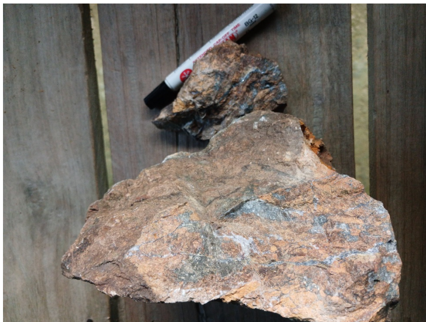
Gambar 5. Sampel yang memperlihatkan keterdapatan mineral antimoni serta mineral kuarsa dalam bentuk vein .

Pada sampel ketiga (Gambar 4) yang diperoleh pada daerah penelitian mineral antimoni yang dijumpai pada batuan memperlihatkan warna mineral antimoni yaitu abu-abu metalik, tekstur batuan massif dengan indikasi terjadi alterasi pada batuan. Mineral antimoni pada sampel memperlihatkan orientasi menjarum dengan tekstur fissure filling atau mengisi celah batuan (vein). Ketebalan vein mineral antimoni sekitar 1 mm – 3 cm. Selain mineral antimoni mineral kuarsa juga terlihat pada sampel ini (Gambar 4).