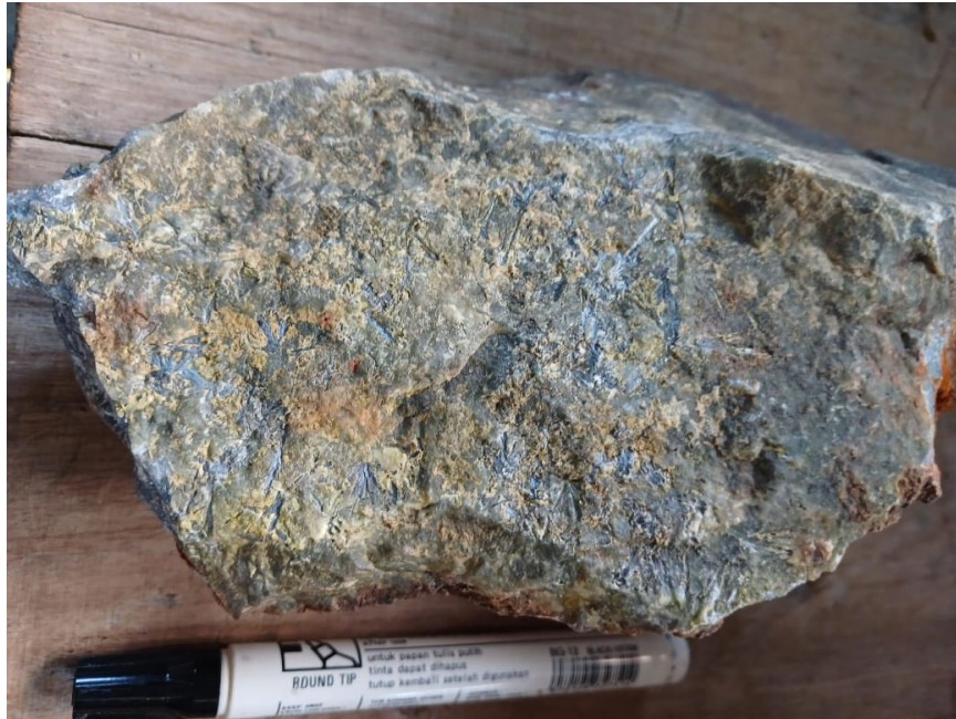
Gambar 4. Sampel yang memperlihatkan keterdapatan mineral antimoni dengan orientasi mineral menjarum.

Pada sampel ketiga (Gambar 4) yang diperoleh pada daerah penelitian mineral antimoni yang dijumpai pada batuan memperlihatkan warna mineral antimoni yaitu abu-abu metalik, tekstur batuan massif dengan indikasi terjadi alterasi pada batuan. Mineral antimoni pada sampel memperlihatkan orientasi menjarum dengan tekstur fissure filling atau mengisi celah batuan (vein). Ketebalan vein mineral antimoni sekitar 1 mm – 3 cm. Selain mineral antimoni mineral kuarsa juga terlihat pada sampel ini (Gambar 4).