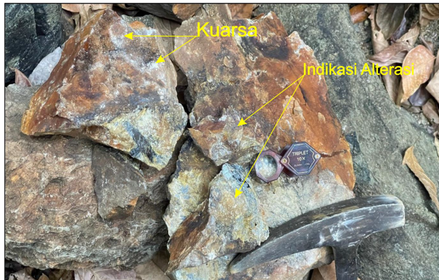
Gambar 2. Sampel batuan yang memperlihatkan indikasi alterasi dan mineral kuarsa

Keterdapatannya mineral antimonium pada daerah penelitian dijumpai dalam bongkahan batuan yang diindikasikan mengalami proses alterasi (Gambar 2). Sampel yang diambil juga memperlihatkan kenampakan mineral antimonium dengan tekstur menjarum (Gambar 4). Mineral kuarsa juga dijumpai dalam sampel yang diambil dalam bentuk vein atau urat yang memperlihatkan tekstur fissure filling (tekstur pengisian).