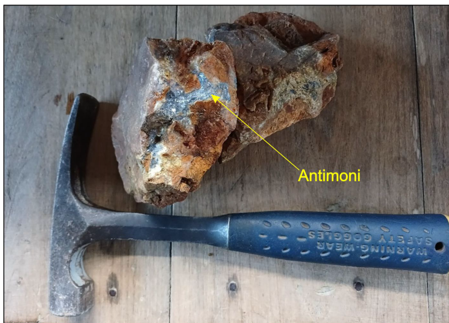
Gambar 3. Sample floating yang memperlihatkan mineral antimonium menunjukkan mineralisasi metalik massif.

Mineral antimonium yang dijumpai pada daerah penelitian memperlihatkan ciri fisik berupa warna segar abu-abu metalik dan warna lapuk kecokelatan (Gambar 3). Mineral antimonium pada sampel yang diambil memiliki kilap logam dan gores abu-abu. Kekerasan mineral antimonium 3-3,5 dalam skala mosh dan memiliki sistem kristal hexagonal (Mottana et al., 1978).