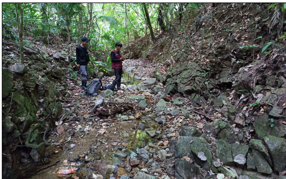
Gambar 1. Kondisi sungai di lokasi Salo Lampe termasuk sungai periodik.

Diperoleh keterdapatannya antimonium di daerah Barru, tepatnya di Kecamatan Tanete Rilau. Antimonium yang diperoleh berada di 3 lokasi yang berbeda yaitu Salo Lemoe, Salo Lampe, dan Salo Bettie. Ketiga daerah ditemukan antimonium adalah daerah sungai periodik. Saat penelitian ini dilakukan, kondisi Sungai dalam keadaan kering. Sampel antimonium yang diperoleh berupa floating (bongkah).